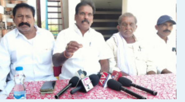
సాధనకు ఉద్యమం కొనసాగిస్తోందని తెలిపారు.

దానిలో భాగంగా బద్వేలు నియోజకవర్గంలో మండల, గ్రామ స్థాయి నుంచి సంఘాన్ని పూర్తిస్థాయిలో నిర్మించాలనే సంకల్పంతో ఈ కార్యక్రమం నిర్వహిస్తున్నామని చెప్పారు. రాష్ట్ర ప్రభుత్వం ఎన్నికల మేనిఫెస్టోలో అధికారంలోకి వచ్చిన వెంటనే బీసీలకు రక్షణ చట్టం తీసుకొస్తామని హామీ ఇచ్చిందని గుర్తు చేశారు. అలాగే గత ప్రభుత్వంలో 34 శాతంగా ఉన్న బీసీ రిజర్వేషన్లను 24 శాతానికి తగ్గించారని, అధికారంలోకి వచ్చిన తరువాత మళ్ళీ 34 శాతానికి పెంచి స్థానిక సంస్థల ఎన్నికలు నిర్వహిస్తామని ప్రభుత్వం హామీ ఇచ్చిందన్నారు.